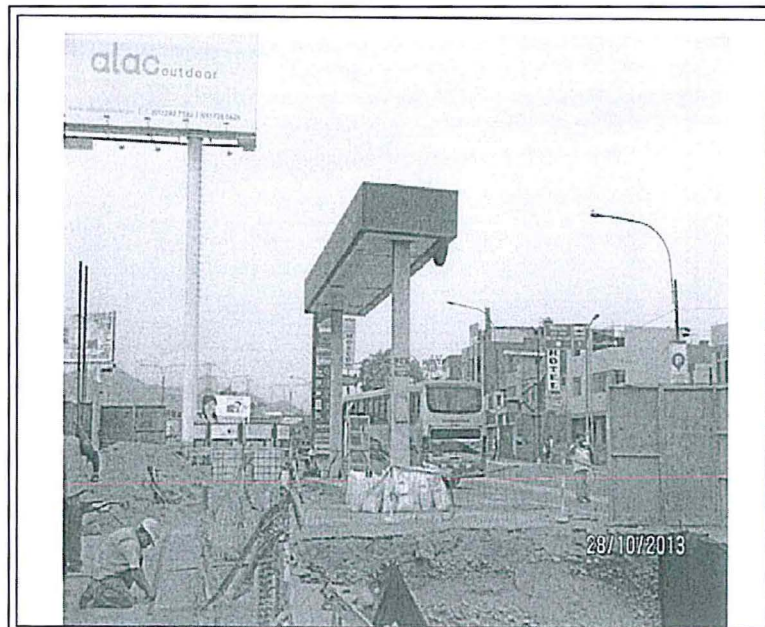
Fotografía N° 2: Se observa que el perímetro de la estación de Servicios “San Francisco” no ha sido cerrado en su totalidad.

13. Sin embargo, en la supervisión regular del 28 de octubre de 2013 realizada por la Dirección de Supervisión, se verificó que Repsol no realizó el cercado total del perímetro del área de abandono, con el fin de prevenir la entrada de personas no autorizadas durante el tiempo que realicen los trabajos de inhabilitación, conforme se detalla a continuación 11 :