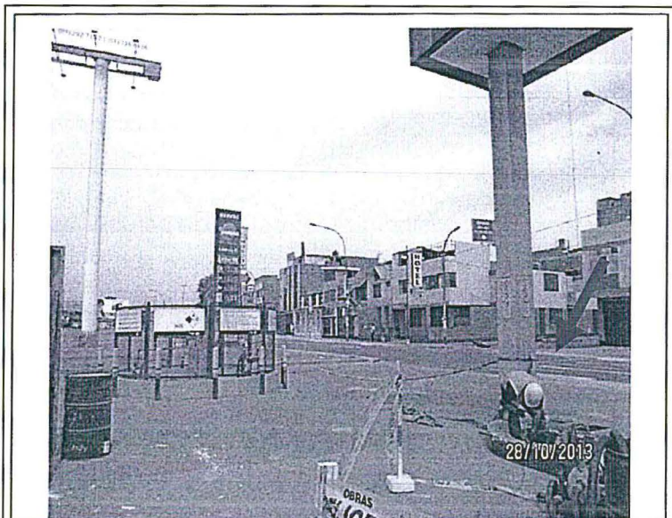
Fotografía N° 4: Lado sur de la Estación de Servicios "San Francisco" que tampoco ha sido cerrada durante la ejecución del abandono parcial de los tanques d combustibles.