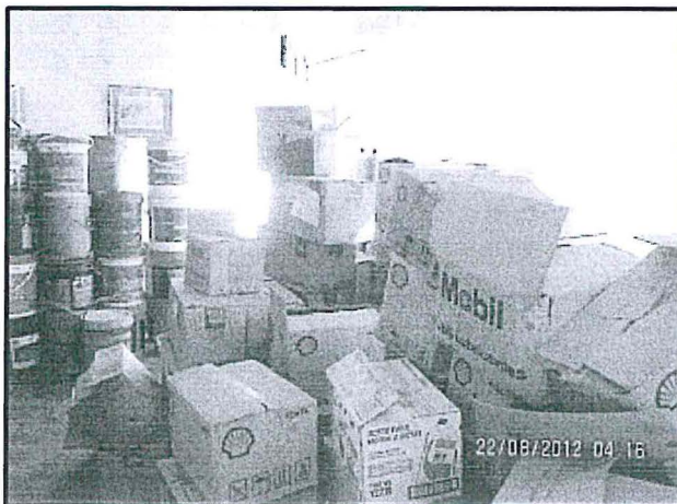
Fotografía 4. Vista del almacén con cajas conteniendo Lubricantes, filtros y otros productos, colocados inadecuadamente (desordenados), la misma que no tiene un sistema de doble contención de propiedad de la Estación de Servicios Malaver Salazar Asociados".