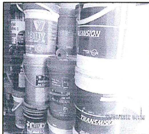
Fotografía 3. Vista del almacén con lubricantes en condiciones no adecuadas (desordenados) de propiedad de la "Estación de Servicios Malaver Salazar Asociados".