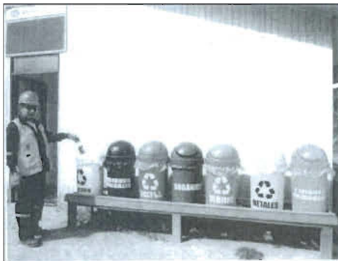
Figura N° 1: Implementación de recipientes rotulados