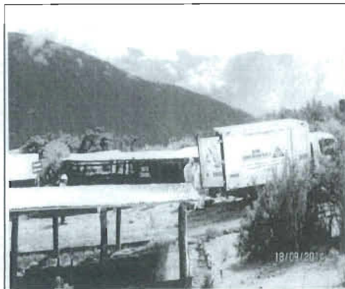
Figura N° 3: Se observa la disposición de residuos sólidos