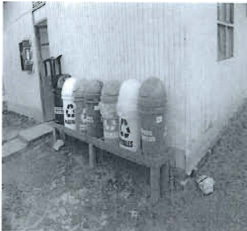
Fotografía N° 67.- Depósitos temporales identificados con código de colores en el proyecto de exploración Anubia.