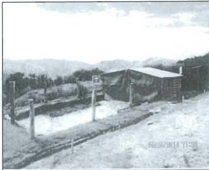
Figura N° 2: Implementación del Almacén temporal de residuos sólidos con su trinchera correspondiente.