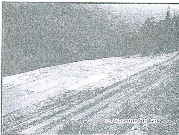
FOTOGRAFÍA N° 48: Hallazgo N° 02 Depósito de Relaves N° 1 y 2 se encuentran cubiertos con varias mantas impermeables de polipropileno y se ubica dentro de las instalaciones de Taboraqué.