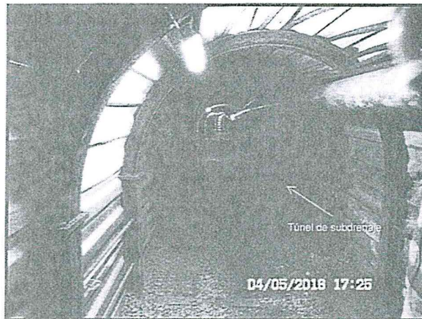
FOTOGRAFÍA N° 30: Depósito de Relaves N° 01 y N° 02. Por otro lado, en la parte baja cuenta con un túnel que recorre debajo de los depósitos y que colecta las aguas de subdrenaje en un caja impermeabilizada (1 m3) y luego se deriva por una tubería de HDPE 6" hacia la planta de neutralización para tratamiento.