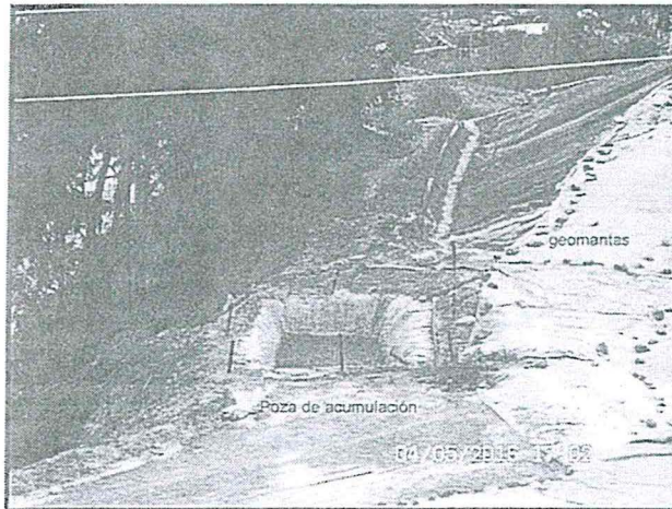
FOTOGRAFÍA N° 29: Depósito de Relaves N° 01 y N° 02. Además, la superficie de los depósitos se encontraba cubiertas con varias mantas impermeables de polipropileno y sobre la parte superior cuenta con dos pozas impermeabilizadas (18 m3 aproximadamente) con el mismo materia para evitar el contacto con el agua de precipitación.