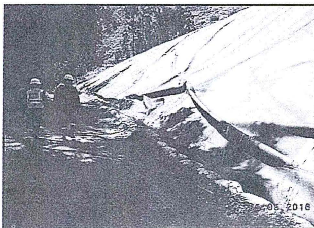
FOTOGRAFÍA N° 49 Hallazgo N° 02. El talud del Depósito de Relaves N° 1 y 2 se encuentran cubierto con geomembrana y se ubica dentro de las instalaciones de Tamboraque.