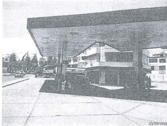
Imagen 3: Estación de Monitoreo A-3 Islas 10