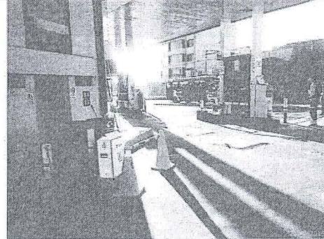
Imagen 2: Estación de Monitoreo A-2 Tuberías de Ventilación 9