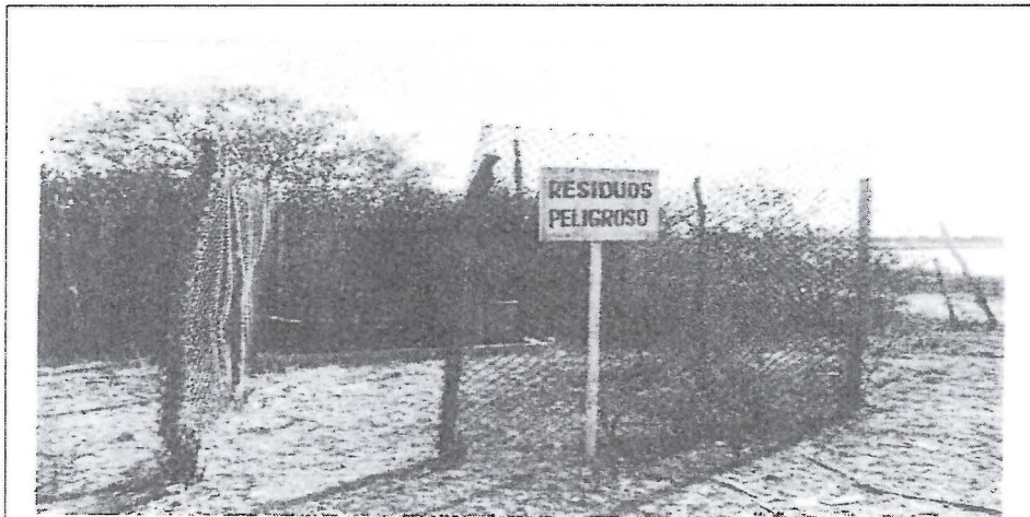
FOTO N° 23.- CENTRO DE ACOPIO DE RESIDUOS PELIGROSOS, NOTESE SIN PUERTA TECHO, LOZA DE CONCRETO.