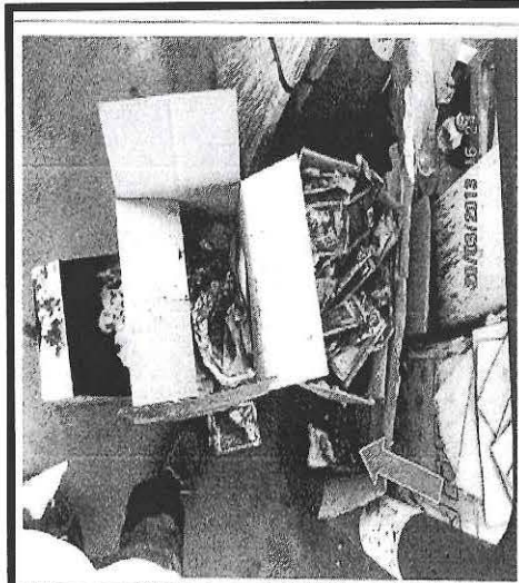
Fotografía 3. Residuos sólidos peligrosos (envolturas de aceite) dispuestos en cajas de cartón conteniendo del cual emanaban restos del líquido (aceite), ubicados a un lado de la isla de combustible de la estación de servicios