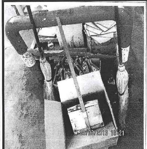
Fotografía 4. Vista lateral de las cajas de cartón que contiene residuos sólidos peligrosos, ubicados en la isla de combustible de la estación de servicios