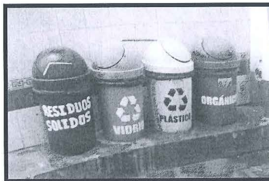
Fotografías presentadas en su escrito de descargos de fecha 26.01.17

23. En sus descargos, el administrado señaló que viene cumpliendo con realizar un adecuado acondicionamiento de los residuos sólidos, ya que se implementaron tachos en la estación de servicios de su titularidad, conforme se observa a continuación: