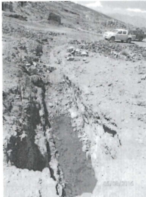
Fotografía N° 14: Vista posterior del rajo L3-R1-SS. Se observó presencia de agua empozada dentro del rajo.