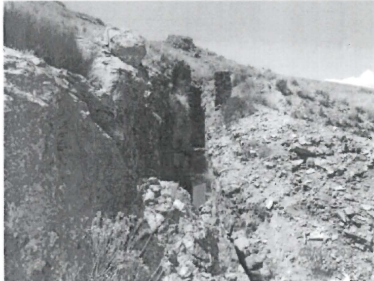
Fotografía N° 15: Vista panorámica del rajo L3-R2-SS. Se observó que no se ha colocado material de relleno en el rajo. Presencia de agua empozada dentro del rajo.