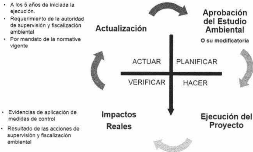
FIGURA 2: CICLO DE LA MEJORA CONTINUA APLICADO AL PROCESO DE EVALUACIÓN DEL IMPACTO AMBIENTAL

de Deming o ciclo de la mejora continua, podemos observar las siguientes etapas: