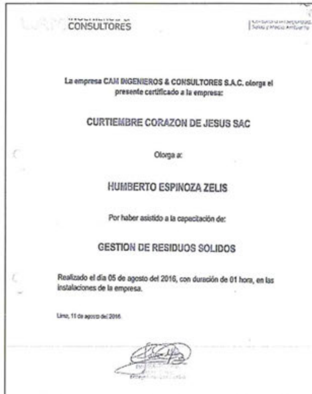
Imagen N° 6: Certificado de capacitación de la empresa consultora Cam Ingenieros & Consultores S.A.C.