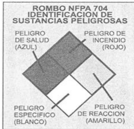
Figura N° 1: Vista del rombo de seguridad, de acuerdo la NFPA 704