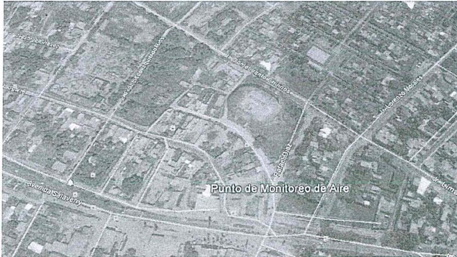
Imagen capturada del 1 de mayo de 2015