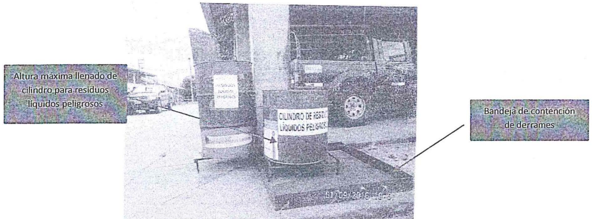
Imagen N° 3 Implementación del sistema de contención