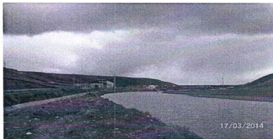
Fotografía N° 44: Vista del río San Juan, aguas debajo de la hidroeléctrica Jupayragra