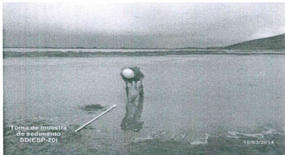
Fotografía N° 20: Sedimentos ubicados en la confluencia del río San Juan y el Delta Upamayo.