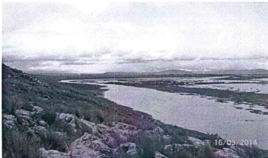
Fotografía N° 10: Drenaje fluvial dendrítico al ingreso del río San Juan hacia el Delta Upamayo.