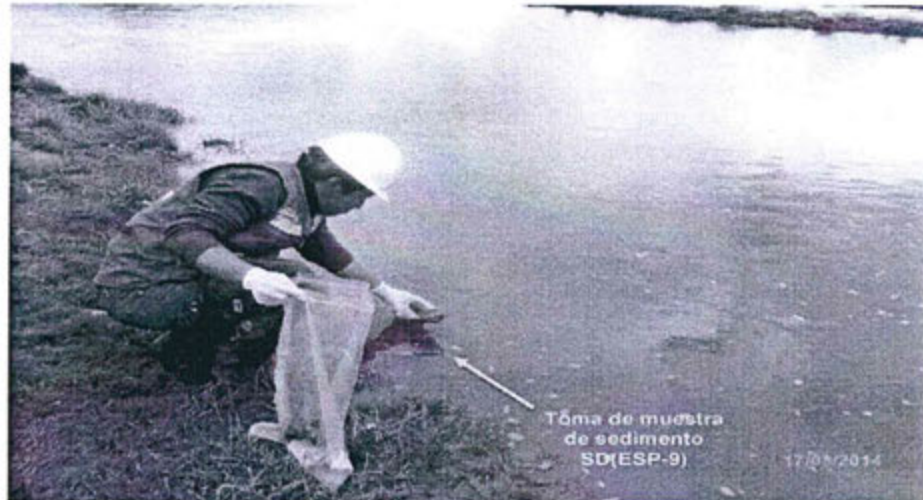
Fotografía N° 36: Sedimentos ubicados en el río San Juan, aguas arriba del centro poblado Sacrafamilia.