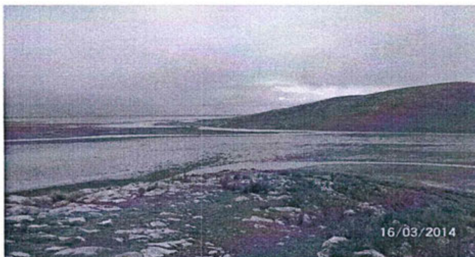
Fotografía N° 13: Zona de ingreso del río San Juan al Delta Upamayo. Se observa vegetación y que el Delta Upamayo se encuentra inundado en época de avenida (marzo 2014).