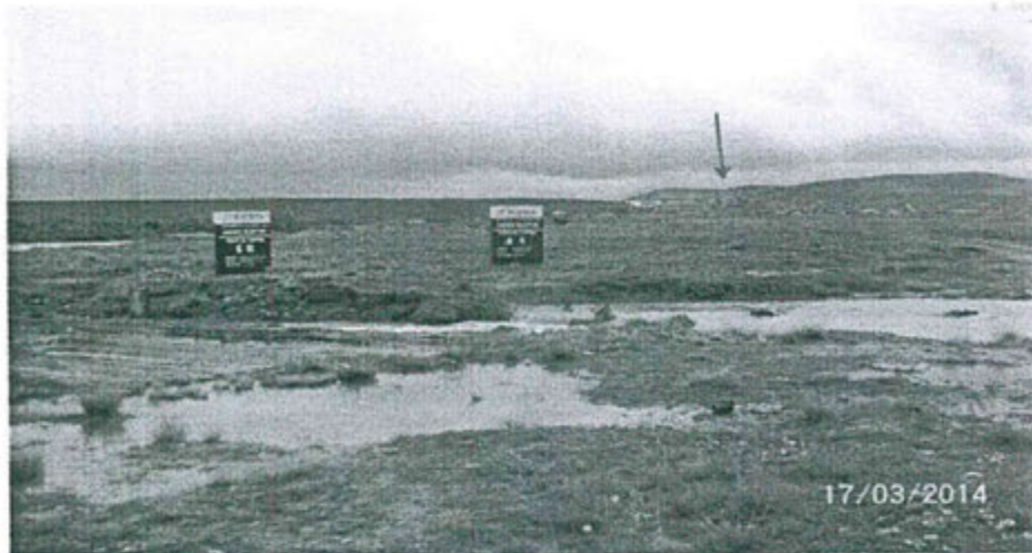
Fotografía N° 45: Río San Juan y al fondo se observa la UM Colquijirca de Sociedad Minera El Brocal S.A.A.