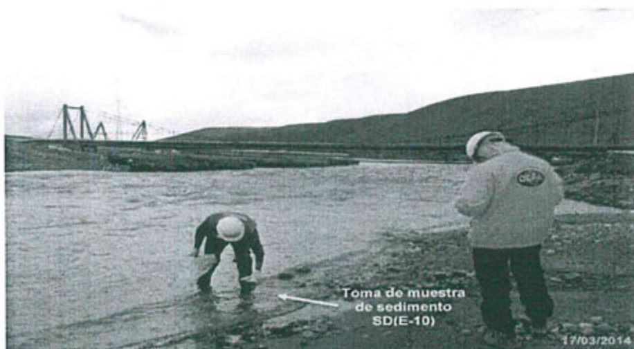
Fotografía N° 32: Sedimentos ubicados en el río San Juan, 40 metros aguas arriba de la descarga del efluente E-9.