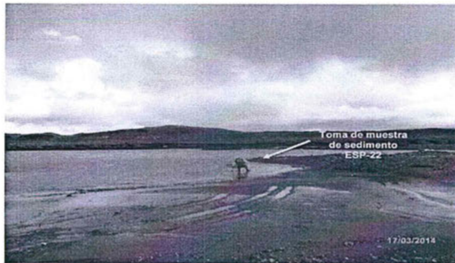
Fotografía N° 38: Sedimentos ubicados en el río San Juan, 30 metros aguas debajo de la confluencia con la quebrada Andascancha.