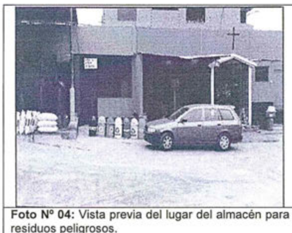
Foto N° 04: Vista previa del lugar del almacén para residuos peligrosos.