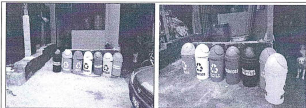
Foto N° 01: Tachos para almacenar residuos sólidos no peligrosos, los cuales se encuentran en la parte frontal del almacén.