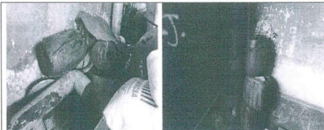
Fotografía N° 1: Se observa envases de plástico en desuso, impregnados con pintura.