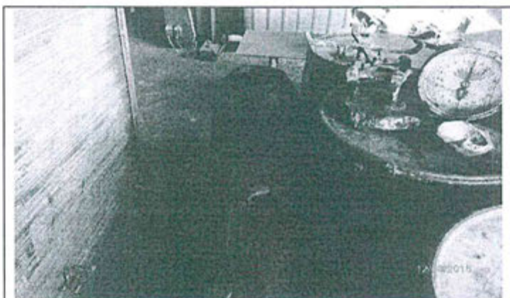
Fotografía N° 3: Se observa envases de plástico en desuso, impregnados con pintura y apilados sobre el piso de cemento.