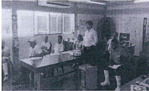
Fotografías remitidas el 12 de setiembre del 2016