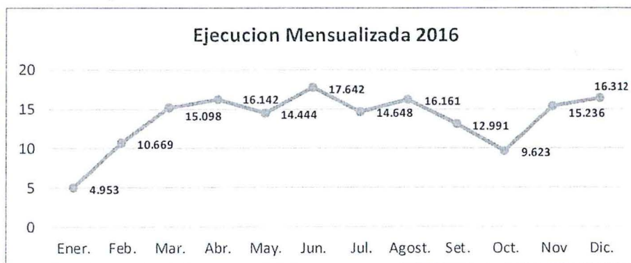
Ejecución mensualizada a nivel de devengado (2016)