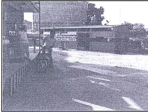
Fotografía N° 3: La Estación de Servicios – Negociación San Martín S.A.C. no cuenta en su totalidad con una losa de concreto, adecuadamente impermeabilizada.