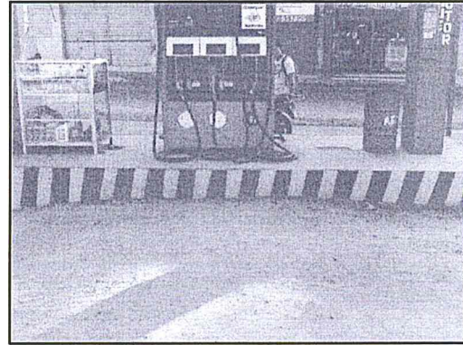
Fotografía N° 4: La Estación de Servicios – Negociación San Martín S.A.C. no cuenta en su totalidad con una losa de concreto, adecuadamente impermeabilizada.