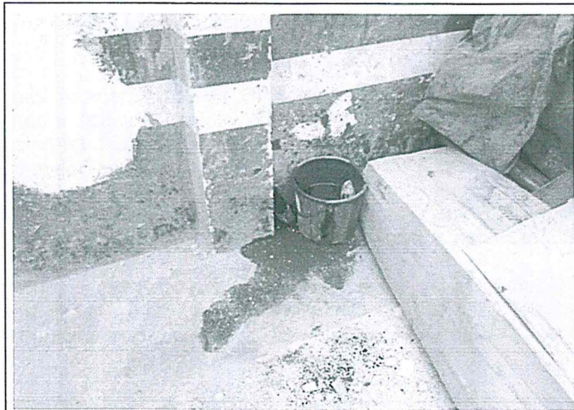
Fotografía 5. Vista interior de la estación de servicios, se aprecia un recipiente (balde) conteniendo aceite usado, y a su alrededor una mancha de aceite en el suelo; ubicado en las cercanías del área de lavado.