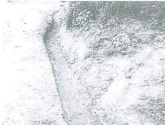
VISTA N° 05: Mantenimiento de cunetas