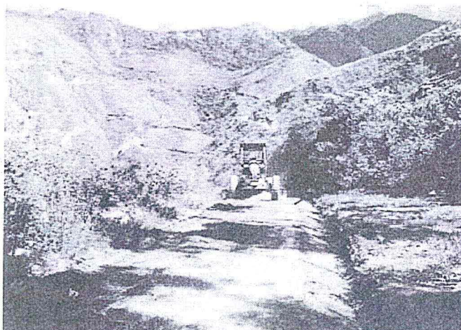
VISTA N° 01: Limpieza y perfilado de cunetas, conformación de plataforma con Motoniveladora