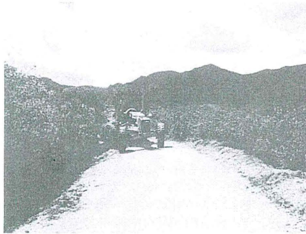
VISTA N° 04: Reconformación de cunetas