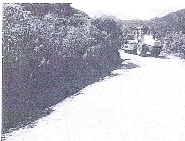
VISTA N° 02: Compactación de plataforma donde se observa el peralte para el drenaje de las aguas por las cunetas