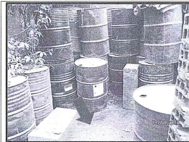
Fotografía N° 1: Cilindros ubicados sobre suelo natural durante la supervisión realizada por el OEFA