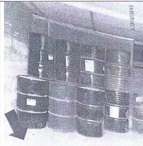
Fotografía N° 2: Cilindros ubicados sobre suelo impermeabilizado después de implementar lo ordenado en la medida correctiva