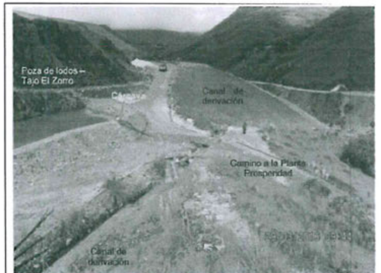
Fotografía 05. Vista panorámica de la descarga de aguas de la poza a través de la cárcava formada en el talud.