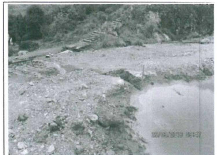
Fotografía 06. Vista de la descarga de aguas de la Poza de Lodos a través de la cárcava.