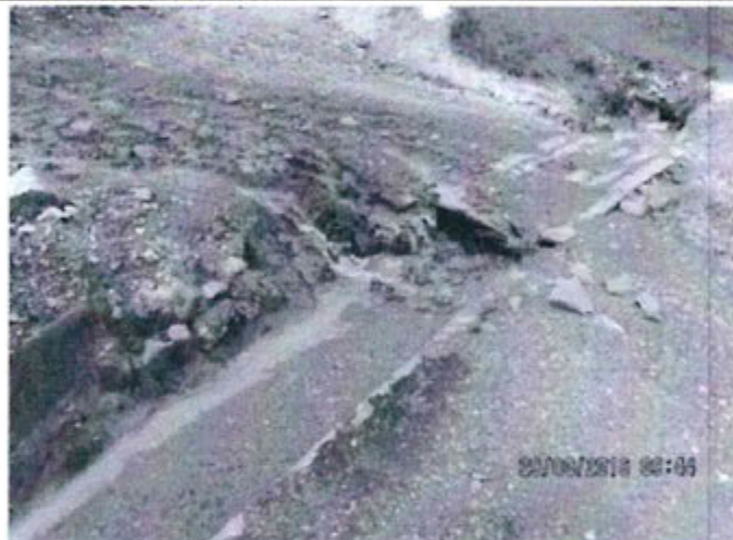
Fotografía 09. Vista del canal de derivación de aguas del tajo El Zorro, el mismo que esta recibiendo las aguas de la poza de lodos.