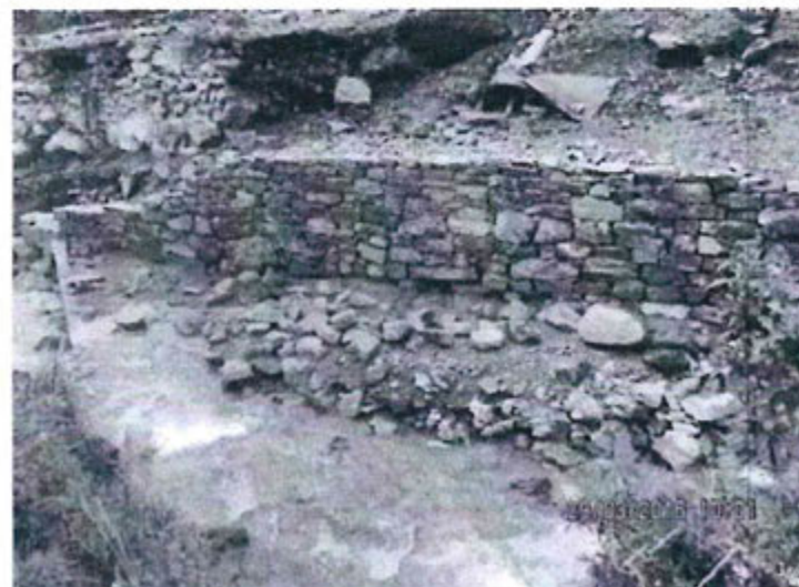
Fotografía 11. Vista de la descarga de las aguas del canal de derivación hacia el riachuelo Las Águilas (Margen derecho).