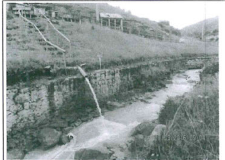
Fotografía 02. Vista de la descarga de aguas en el Punto M-7, hacia el río El Tingo.