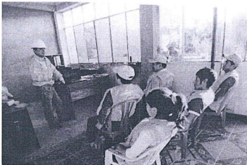
Fotografía N° 1: Capacitación sobre monitoreo ambiental