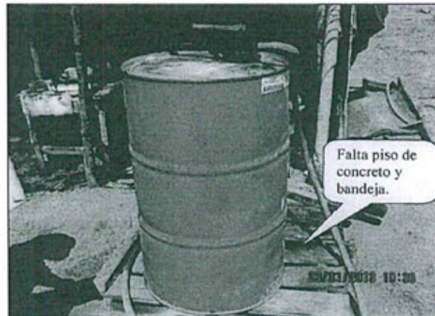
Fotografía N° 9.- Hallazgo N° 8. En las coordenadas UTM WGS-84, 229869 E y 8107722, se encontró un cilindro de lubricantes sobre una parihuela que no tiene loza de concreto ni bandeja para controlar el derrame (Cercano a la plataforma de perforación diamantina N° 14).