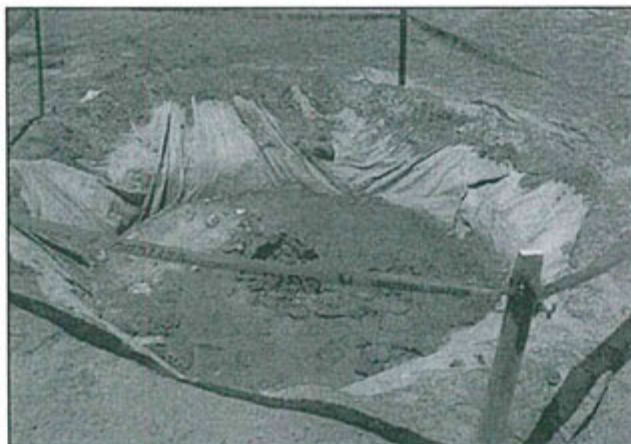
Fotografía N° 16.- Poza de lodos provenientes del área de corte de testigos de perforación, se encuentran a la intemperie y sin malla de seguridad que impida el ingreso de animales silvestres.