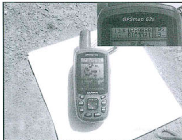
Fotografía N°1: Ubicación del punto