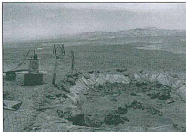
Fotografía N° 17.- Poza de lodos provenientes del sector de corte de testigos, se observa una malla precaria que no cumple su cometido de proteger el ingreso de animales silvestres.