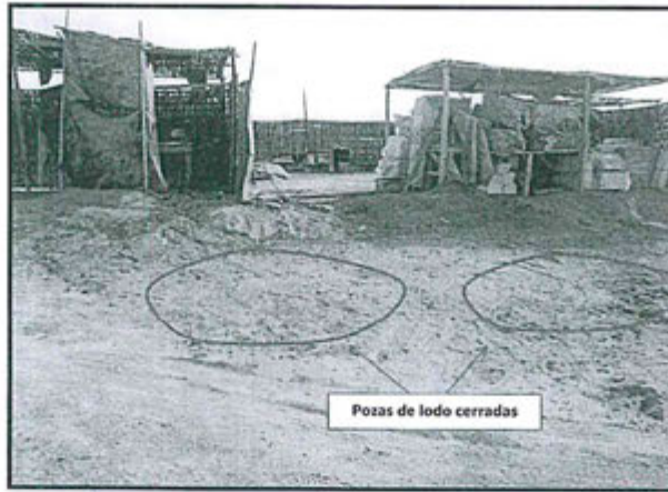
Fotografía N° 04: Pozas de lodo del área de corte completamente cerradas, ejecutado el 15/12/13.