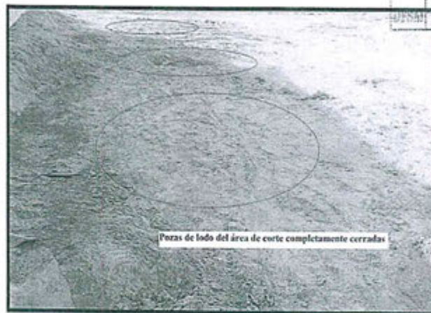
Fotografía N° 05: Pozas de lodo cerradas por completo