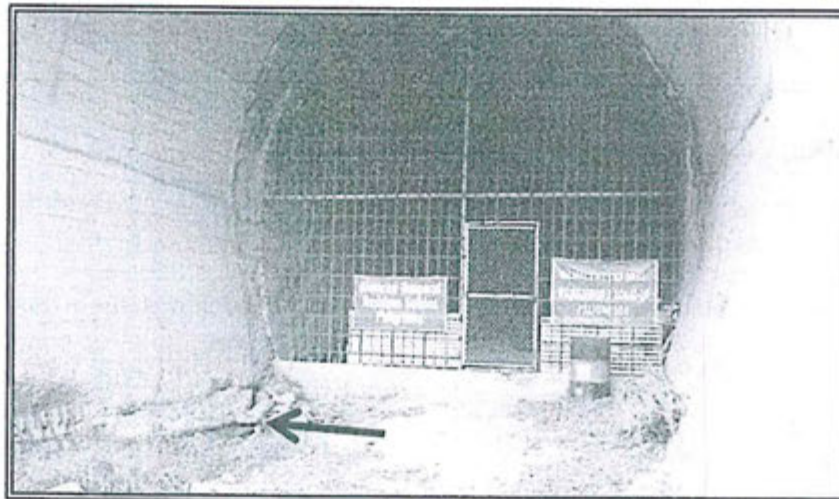
Vista N° 6 del Informe de Supervisión