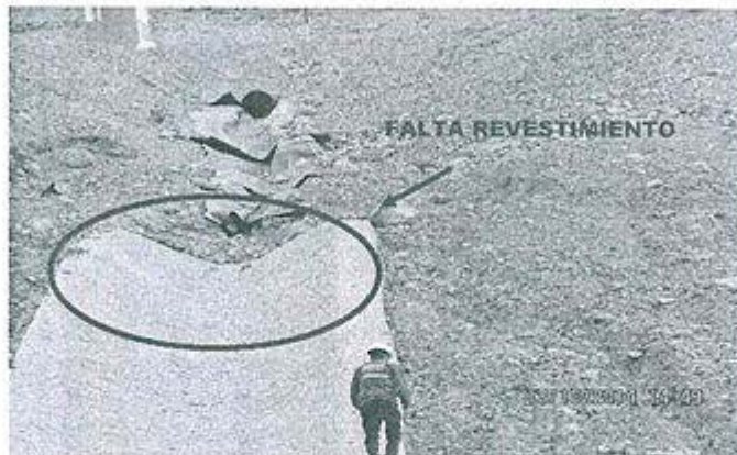
Fotografía N° 186: Hallazgo N° 1: En el canal de derivación de aguas de escorrentía del Depósito de desmontes, en las coordenadas UTM Datum WGS 8 029 192 N y 413 964 E, se evidenció que un tramo del canal se encuentra sin revestimiento.