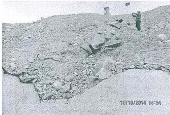
Fotografía N° 185: Hallazgo N° 1. En el canal de derivación de aguas de escorrentía del Depósito de desmontes, en las coordenadas UTM Datum WGS 8 029 192 N y 413 964 E, se evidenció que un tramo del canal se encuentra sin revestimiento.