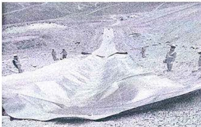
Fotografía N° 188: Hallazgo N° 1: Durante el desarrollo de la supervisión se verificó que el titular minero realizó el revestimiento mediante la colocación de geomembrana en el tramo del canal indicado en las coordenadas UTM Datum WGS 84; 8 029 192 N y 413964 E.