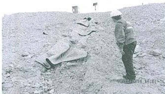
Fotografía N° 186: Hallazgo N° 1: En el canal de derivación de aguas de escorrentía del Depósito de desmontes, en las coordenadas UTM Datum WGS 8 029 192 N y 413 964 E, se evidenció que un tramo del canal se encuentra sin revestimiento.