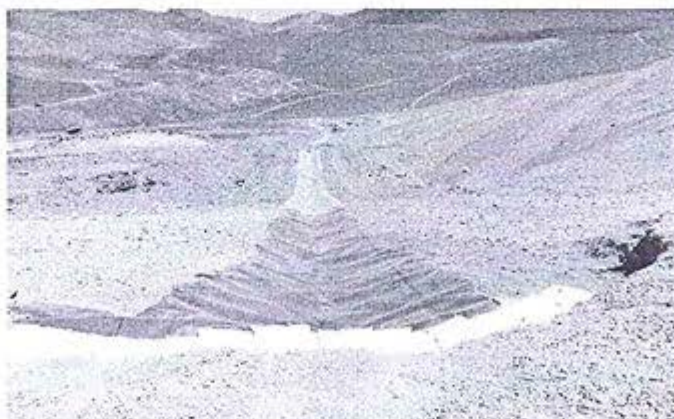
Fotografía N° 189: Hallazgo N° 1: Durante el desarrollo de la supervisión se verificó que el titular minero realizó el revestimiento mediante la colocación de geomembrana en el tramo del canal indicado en las coordenadas UTM Datum WGS 84; 8 029 192 N y 413964 E.