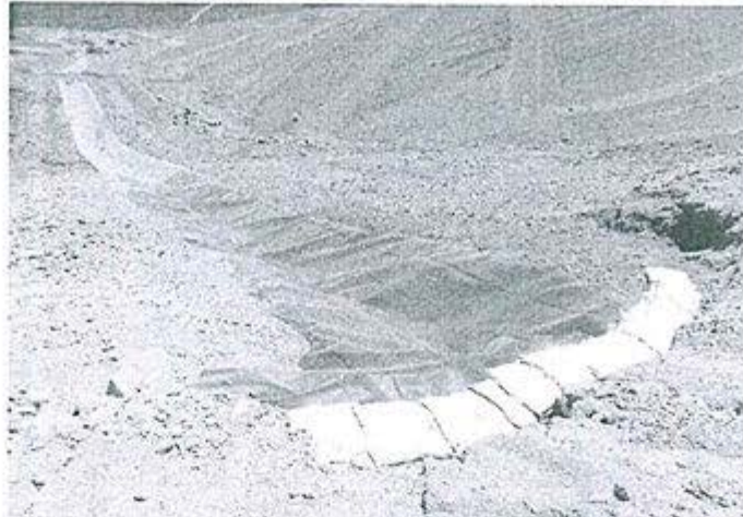
Fotografía N° 190: Hallazgo N° 1: Durante el desarrollo de la supervisión se verificó que el titular minero realizó el revestimiento mediante la colocación de geomembrana en el tramo del canal indicado en las coordenadas UTM Datum WGS 84; 8 029 192 N y 413964 E.