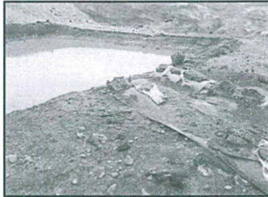
Fotografía N° 84 del Informe de Supervisión.- Poza de sedimentación del depósito de desmonte Pallancata, ubicada en las coordenadas N° 8368768, E: 695895, falta de mantenimiento del canal de ingreso, rotura de costales y presencia de sedimentos (Observación N° 6 de la Supervisión Ambiental 2012)