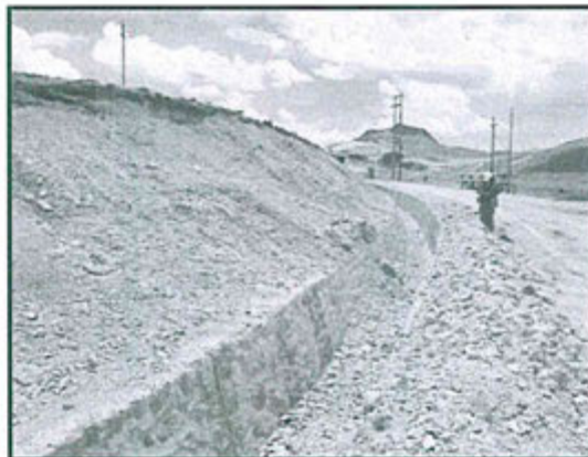
Fotografía N° 81 del Informe de Supervisión.- Derrumbe en un sector del canal de coronación del depósito de relaves N° 3 y el canal no presenta agua (Observación N° 4 de la supervisión ambiental 2012).