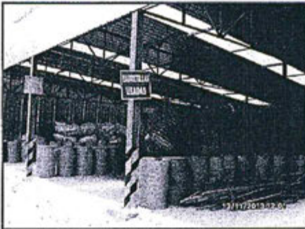
Fotografía 74: ATRI - Área de disposición de Barrilitas Usadas