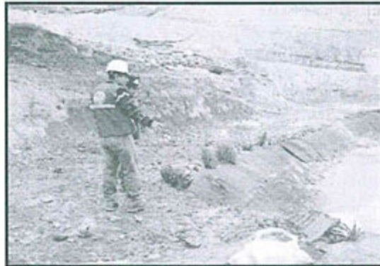
Fotografía N° 84 del Informe de Supervisión.- Otra vista de la poza de sedimentación del depósito de desmonte Pallancata (Observación N° 6 de la Supervisión Ambiental 2012)