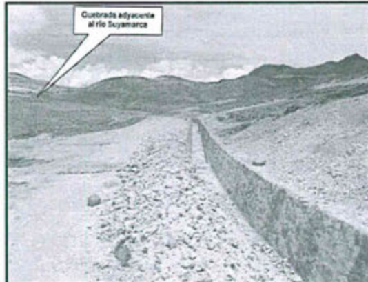
Fotografía N° 10 del Informe de Supervisión.- Tramo final del canal de coronación que descarga a la quebrada adyacente al río Suyumarca.