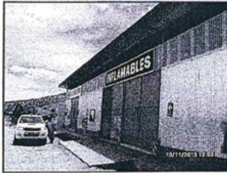
Fotografía 72: ATRI - Ambiente donde se depositan los residuos Inflamables y Polvosos