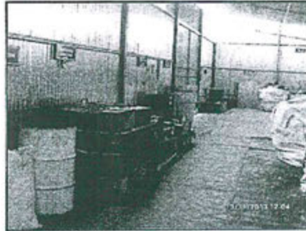
Fotografía 76: ATB – Área de disposición de Baterías Usadas