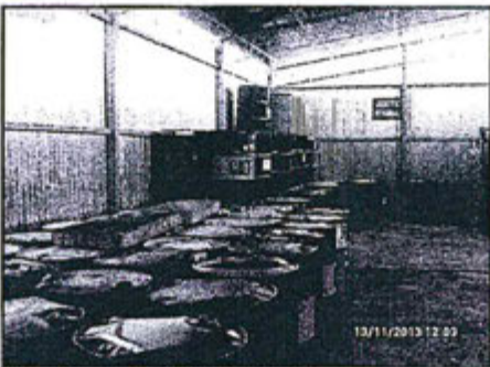
Fotografía 75: ATRI - Área de disposición de Aceite Residual