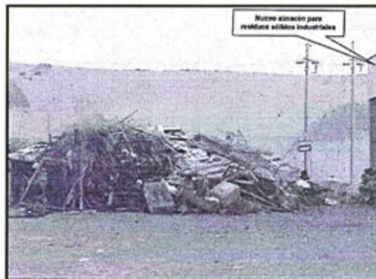
Fotografía N° 86 del Informe de Supervisión.- Zona contigua al nuevo almacén para residuos sólidos industriales sin clasificar y en contacto directo con el suelo. (Observación de gabinete N° 7 de la Supervisión Ambiental 2012)

64. Para acreditar lo señalado, la Dirección de Supervisión presentó la fotografía N° 86 del Informe de Supervisión, en las cuales se observa residuos sólidos industriales sin clasificar y en contacto directo con el suelo en la zona contigua al nuevo almacén para residuos sólidos industriales del Área de Transferencia de Residuos Industriales - ATRI 36 :