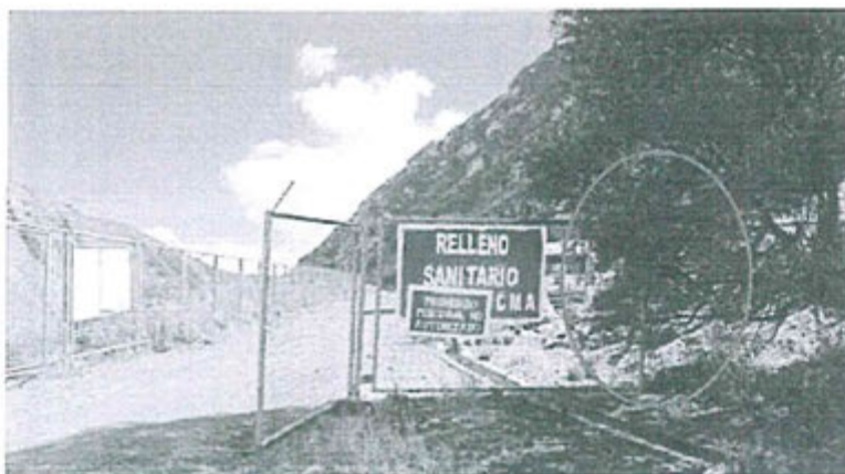
Fotografía N° 68. Observación N° 02 - 2012. Puerta de ingreso que no presenta condiciones de seguridad y protección, donde se encuentra el árbol no existe malla, siendo uno de los puntos de ingreso de animales.