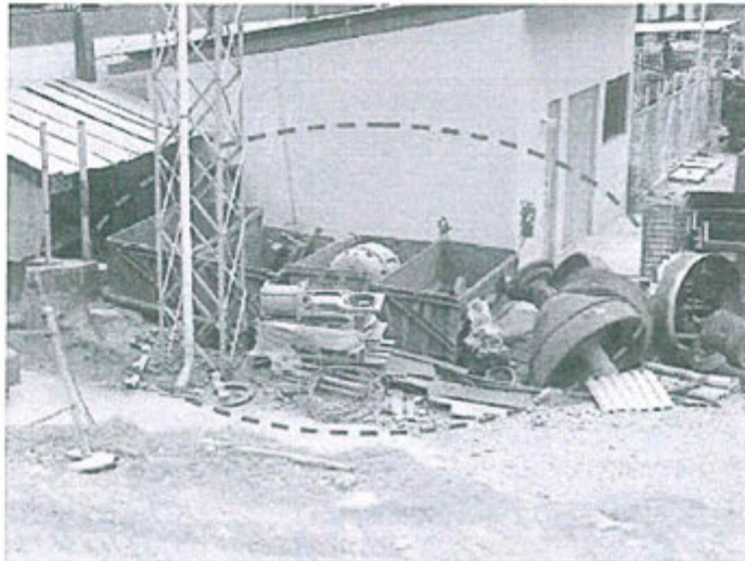
Fotografía 85. Observación N° 09- 2012. En diferentes sectores de la superficie de la unidad minera se observa el almacenamiento de equipos en desuso sin ningún acondicionamiento que evite el contacto con el ambiente.