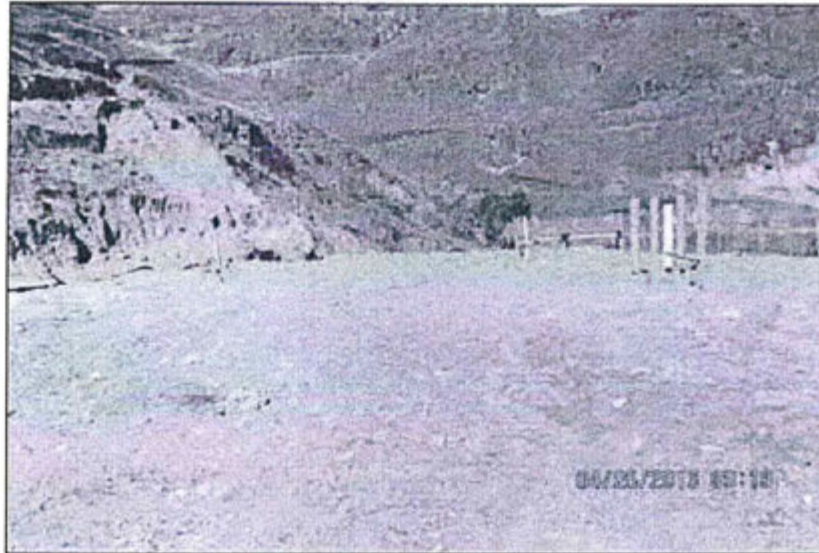
Fotografía N° 3: Se observa el relleno sanitario el cual se encontró libre de materiales.