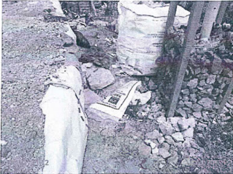
Fotografía N° 73. Observación N° 03-2012. Otra zona de la plataforma del relleno sanitario donde se observa la presencia de residuos peligrosos: "sacos de Xantato" (Círculo rojo).