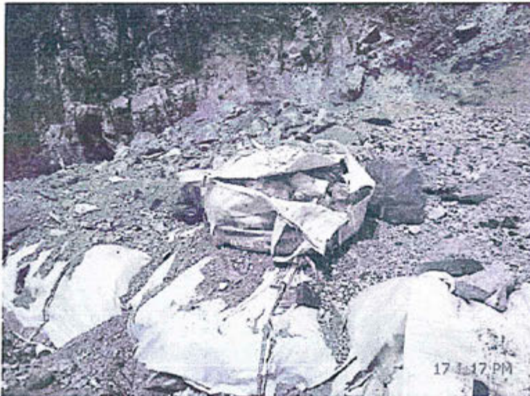
Fotografía N° 74. Observación N°03-2012. En la plataforma del relleno sanitario se observa la presencia de residuos reciclables en sacos (botellas de plásticos), en las coordenadas 8°829 785N, 368 275E (Círculo rojo)