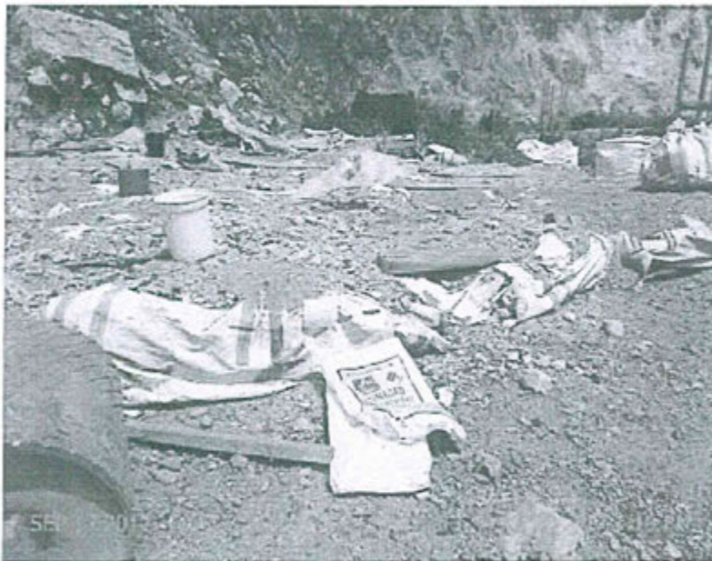
Fotografías N° 72. Observación N° 03-2012. En la plataforma del relleno sanitario se observa la disposición de residuos peligrosos: "sacos de xantato" en las coordenadas UTM WGS-84 8'829 795N - 368 277E.