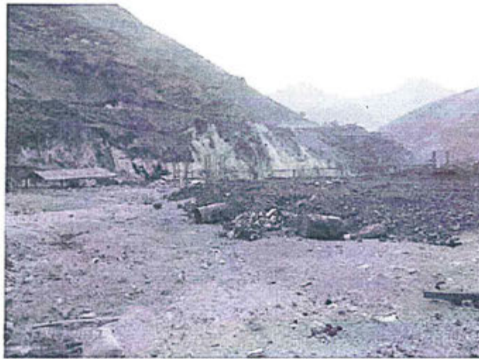
Fotografía N° 97. Observación N° 13-2012 (Gabinete). La disposición final de los residuos sólidos en el relleno sanitario no es correcto, no se han definido los espacios o celdas para la disposición de los residuos de manera estructurada y los residuos no han sido clasificados antes de ser encapsulados o confinados.