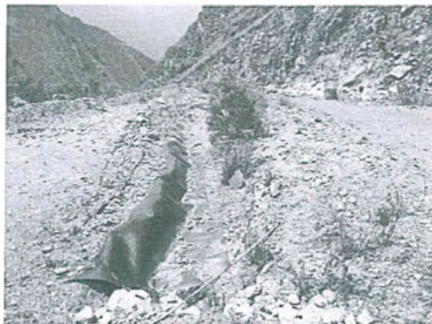
Fotografía N° 66. Observación N° 01-2012. En las coordenadas UTM WGS-84 8'829 792N, 368 282 E, se ubica la canaleta superficial perimetral de captación de aguas de escorrentía impermeabilizada (Círculo punteado) del relleno sanitario, con presencia de sedimentos.