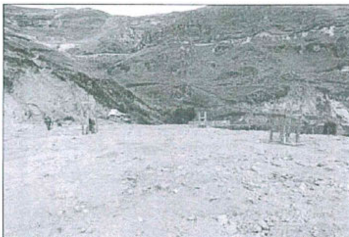
Fotografía N° 6: Vista del Relleno sanitario donde se disponen los residuos sólidos generales. La base está impermeabilizada mediante arcilla y los residuos se encapsulan con material de préstamo.