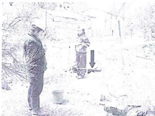
Fotografía N° 105. Efluente doméstico: Punto de control "SF-B" Salida PTAR San Felipe (Flecha roja).