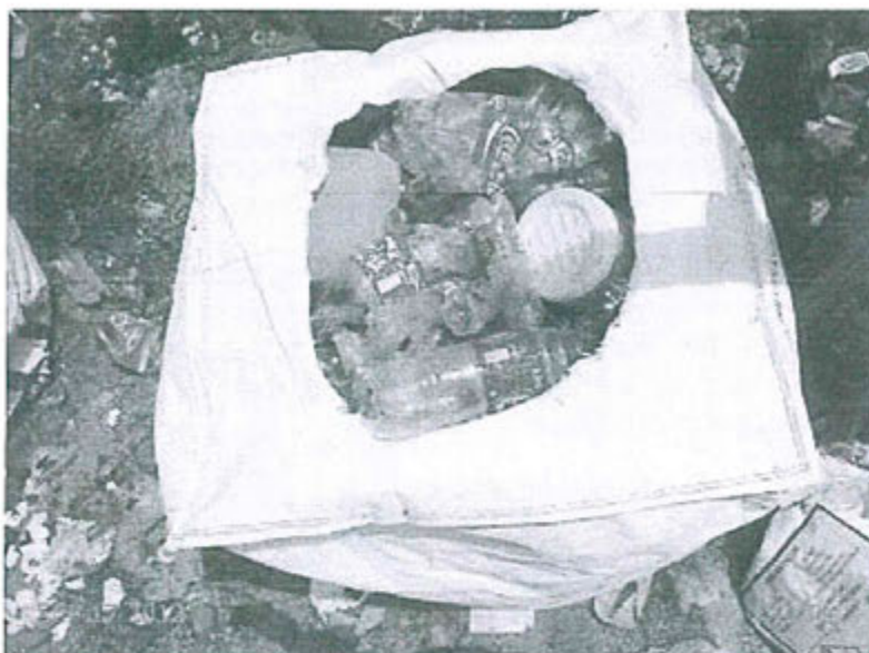
Fotografías N° 75. Observación N° 03-2012. Vista de otro saco que contiene residuos reciclables y que se encuentran dispuestos en la plataforma del relleno sanitario en las coordenadas UTM WGS-84 8'829 799N, 368 282E.