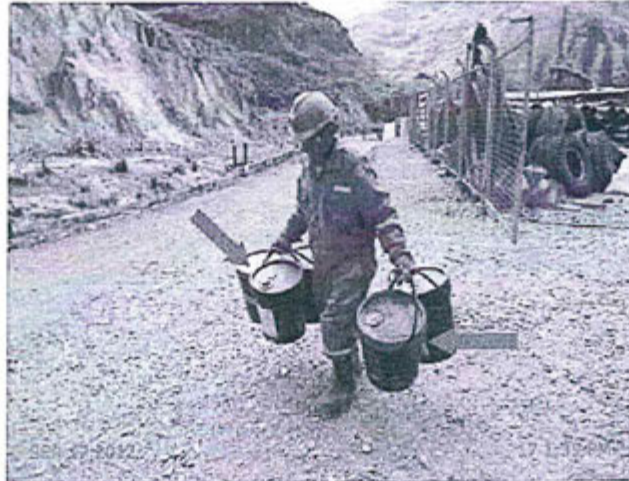
Fotografía N° 77. Observación N° 04-2012: Vista de los envases vacíos de aceites y grasas, dispuestos en el depósito temporal de residuos reciclables. Foto tomada en el momento que eran trasladados hacia el depósito de residuos peligrosos (Flechas rojas).