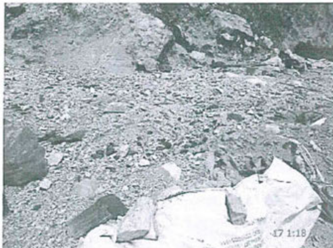
Fotografía N° 98. Observación N° 13-2012 (Gabinete). Los residuos no han sido clasificados antes de su disposición final y se encuentran dispersos a lo largo de la plataforma, el encapsulamiento de los residuos sobre la plataforma para su disposición final no es uniforme dejando al descubierto los residuos.