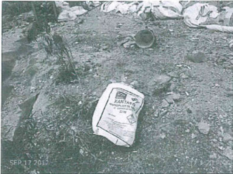
Fotografía N° 71. Observación N° 03-2012. En la plataforma del relleno sanitario se observa la disposición de residuos peligrosos: "sacos de xantato" en las coordenadas UTM WGS-84 8'829 792N y 368 279E. Excremento de burros.