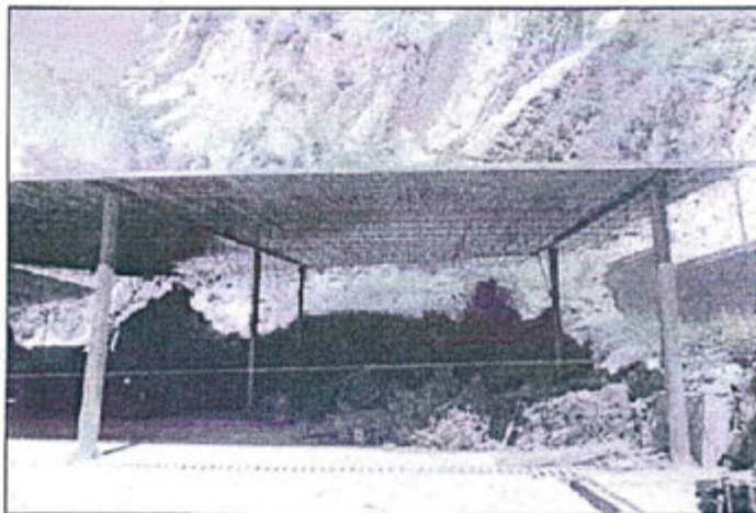
Fotografía N° 5: Almacén temporal de residuos.

como se muestra en la fotografía N° 5, adjunto al referido informe, la cual se muestra a continuación: