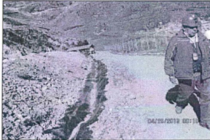
Fotografía N°1: Se puede observar que la canaleta de captación de lixiviados y escurrimiento del relleno sanitario ha sido limpiada.