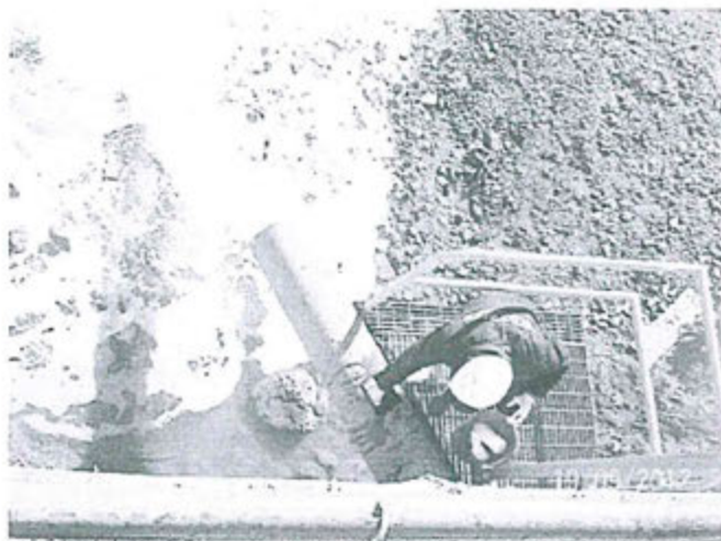
Fotografía N° 101. Efluente industrial: Punto de control "E-09" Descarga de Pozas de Sedimentación al río Huallaga, localizado aguas debajo de la Planta de Beneficio Chicrin.

176. Durante la Supervisión Regular 2012 realizada a la unidad minera Atacocha se tomó una muestra en el punto de control E-09, correspondiente al efluente de la poza de sedimentación que descarga al río Huallaga como se muestra en la siguiente fotografía 77 .