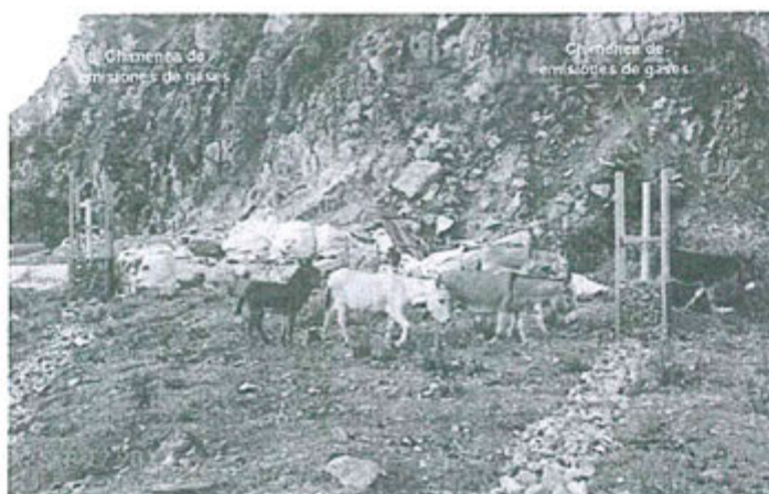
Fotografía N° 69. Observación N° 02-2012. Presencia de burros dentro del relleno sanitario, alimentándose de residuos plásticos, debido a que existen zonas del relleno que no cuentan con cerco perimétrico como barrera sanitaria, que impida el ingreso de animales.