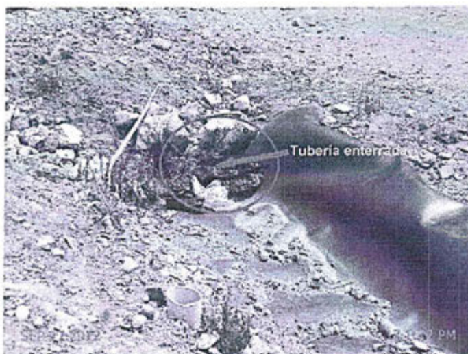
Fotografía N° 67. Observación N° 01 - 2012. Asimismo se observa en la canaleta superficial perimetral, la presencia de bolsas plásticas.