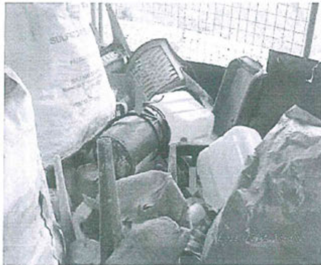
Fotografías N° 76. Observación N° 04-2012. En el depósito temporal de residuos reciclables (coordenadas UTM WG84 0368093E; 8 829763N), se encontró envases vacíos de aceites y grasas (Círculo rojo) junto con botellas de plásticos reciclables (Flecha roja).

119. Lo verificado en la supervisión se sustenta en las fotografías N° 66 y N° 67 contenidas en el Álbum Fotográfico del Anexo 2 del Informe de Supervisión, las cuales se muestran a continuación 57 :