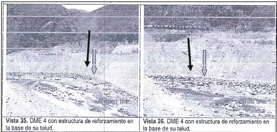
Fotografías N° 25 y 26: DME 4 con estructura de reforzamiento en la base de su talud, tal como señalan las fechas.