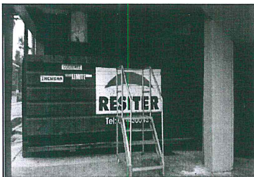
Fotografías 1 y 2: Almacenamiento y evacuación de lodo seco