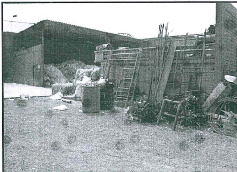
Foto N°15: Área de almacenamiento de residuos metálicos y residuos sólidos comunes