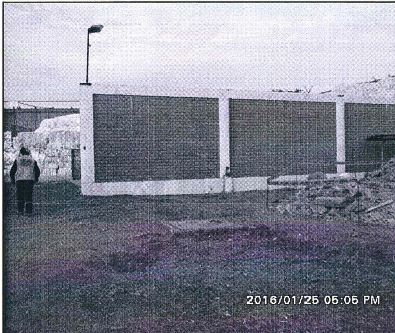
Vista de la antigua área de almacenamiento de Chatarra Residuos Sólidos.