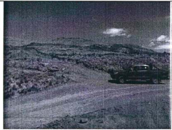
Foto N° 6. Acceso a la cantera magnetita, camioneta entrando al lado derecho, saliendo del lado izquierdo.