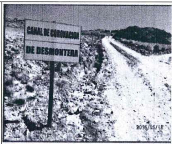
Foto 13: Letrero ubicado al margen del canal de coronación de la desmontera.