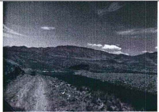
Foto N° 27. Badén sobre el río Cabanillas. De ida hacia paraje Limón Verde.