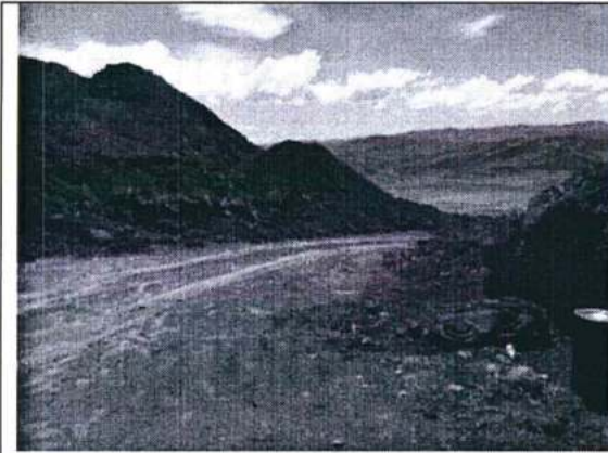
Foto N° 4. Acceso a la Mina Magnetita, se aprecia la cantidad de material de desbroce acumulado a la margen derecha.