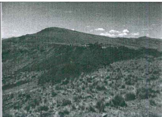
Foto N° 26: Vista panorámica del depósito de desmontes, material acumulado del desbroce.