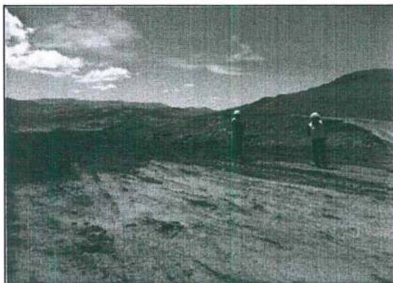
Foto N° 25: Supervisor y Administrado parados sobre el depósito de desmontes, sin georeferenciación y sin canal de coronación.