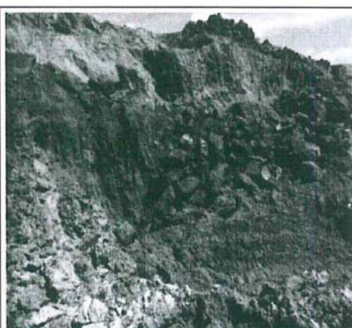
Foto N° 14. Talud interior del tajo Magnetita, altura aproximada unos 30 metros.