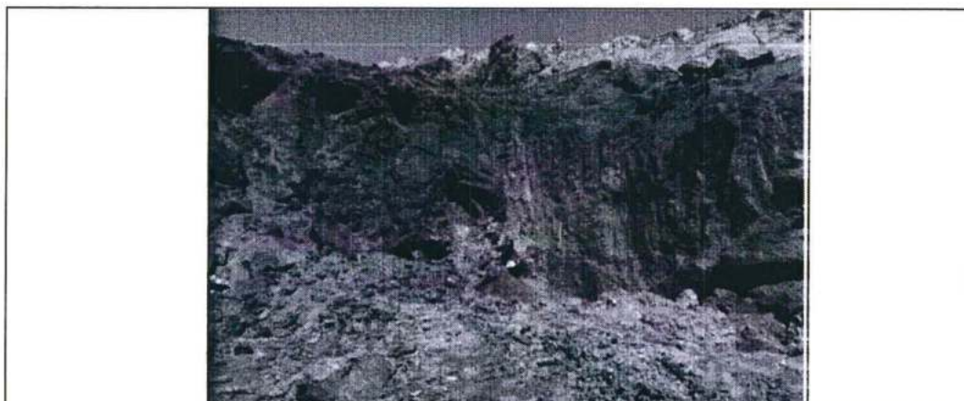
Foto N° 17. Talud vertical del Tajo Magnetita. Rocas al borde de la arista superior, las que podrían desprenderse.

58. En las fotografías se observa lo siguiente: