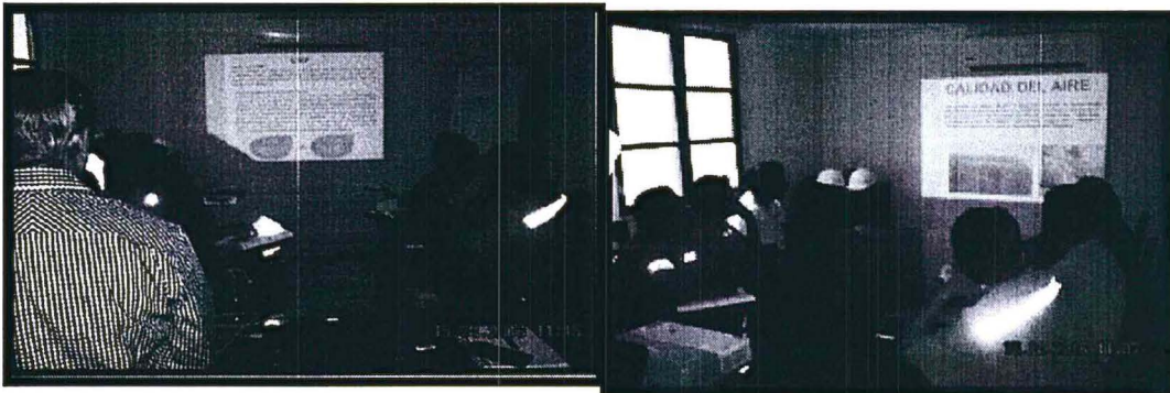
Vistas captadas durante la realización del curso de capacitación realizado el 15 de abril del 2016.