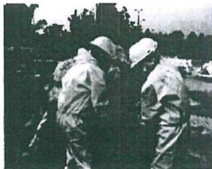
Foto N° 5 y N° 6: Vista de los operarios en plena labor de segregación, quienes cuentan con EPPs adecuados para la manipulación de productos químicos.