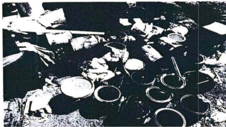
Foto N° 43: Baldes de pintura almacenados a granel, mezclados con otros residuos sin un orden ni rotulación establecida.