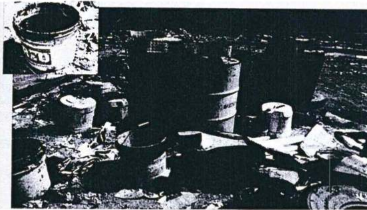
Foto N° 42: Vista de los residuos peligrosos dispuestos sobre suelo natural, mezclados, desordenados, sin distancias de separación adecuadas y sin la rotulación respectiva.