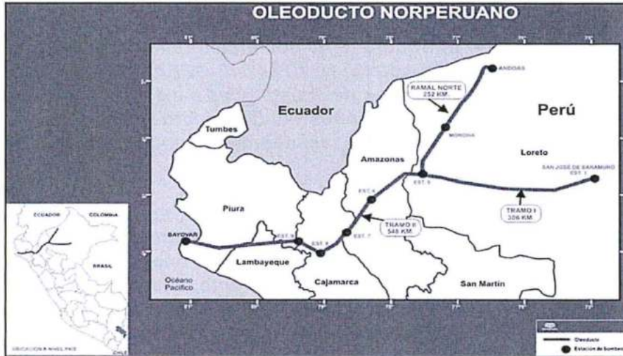
Mapa N° 1: Recorrido del Oleoducto Norperuano

Disponble en: http:// www.petroperu.com.pe/portalweb/VentanasEmergentes.asp?IdVentana=10&Idioma=1 Fuente: Petróleos del Perú – Petroperú S.A. [Consulta realizada el 3 de marzo del 2016].