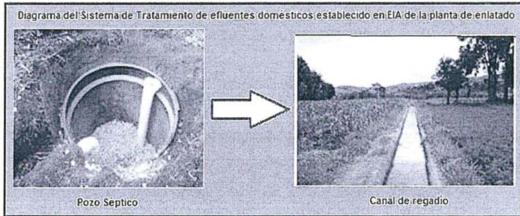
Elaboración: Dirección de Fiscalización, Sanción y Aplicación de Incentivos del OEFA 55