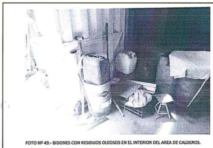
FOTO N° 49.- BIDONES CON RESIDUOS OLEOSOS EN EL INTERIOR DEL AREA DE CALDEROS.