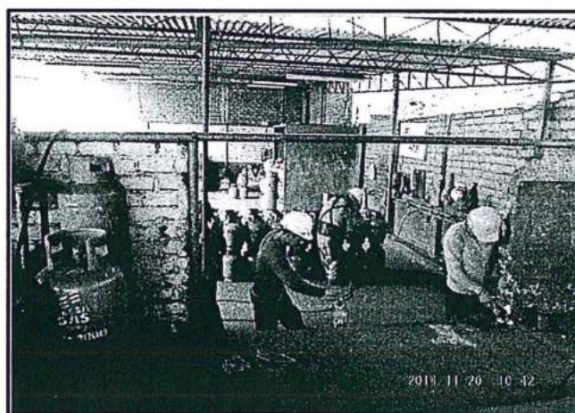
FOTO N° 05: Pintado de Balones de GLP El pintado de balones de GLP, se realiza con soplete en ambiente abierto. Coordenadas UTM (WGS84), Zona 18: 8672297N, 0268336E.