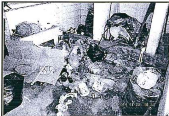
FOTO N° 14: Punto de Acopio de Residuos Sólidos Se observa el acopio inadecuado de residuos sólidos comunes no peligrosos, tales como cartones, y envases plásticos, los cuales se encuentra desperdigados dentro de un ambiente cerrado. Coordenadas UTM (WGS84). Zona 18: 8672284N, 0268367E.