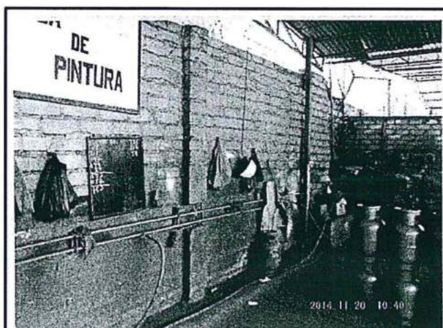
FOTO N° 04: Área de Pintado de Balones de GLP El área de pintado de balones de GLP, se encuentra sobre superficie de losa de concreto. Coordenadas UTM (WGS84), Zona 18: 8672297N, 0268336E.