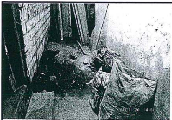
FOTO N° 16: Punto de Acopio de Residuos Sólidos Se observa el acopio inadecuado de residuos peligrosos, tales como envases plásticos con pintura, los cuales se encuentra dentro de un ambiente cerrado. Coordenadas UTM (WGS84), Zona 18 672284N, 0268367E.

56. En el presente caso, a la fecha de emisión de la presente resolución, el administrado no ha presentado descargos al presente procedimiento administrativo sancionador; no obstante, en atención al principio de verdad material previsto en el Numeral 1.11 del Artículo IV del Título Preliminar de la LPAG, la autoridad administrativa competente deberá verificar plenamente los hechos que sirven de motivo a sus decisiones.