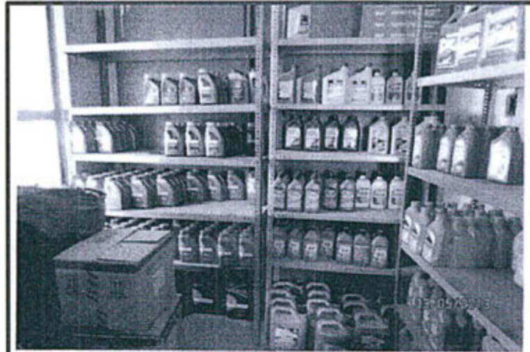
Fotografía 1. Vista del área de almacenamiento de los lubricantes. Se trata de un ambiente ubicado en el segundo piso de la estación de servicio el cual no cuenta con el sistema de doble contención.