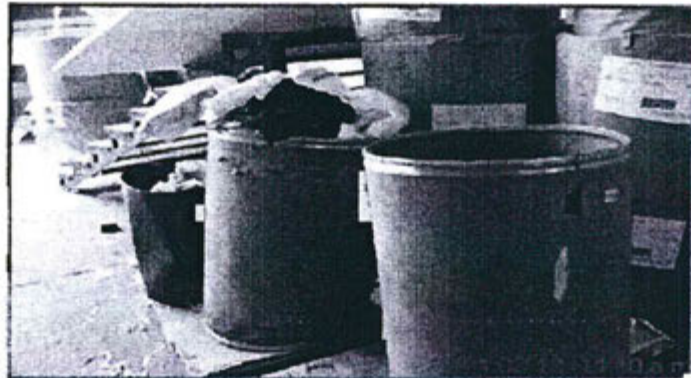
Foto 25. Cilindros de residuos sólidos colmatados y junto a materia prima.