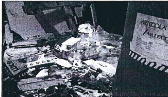
Foto 28. Se observa papeles, cartones, plásticos, resina y madera todos mezclados y fuera de un contenedor.