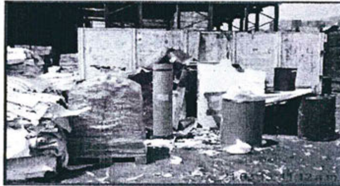
Foto 24. Punto de acopio central de residuos sólidos con cilindros y metal.