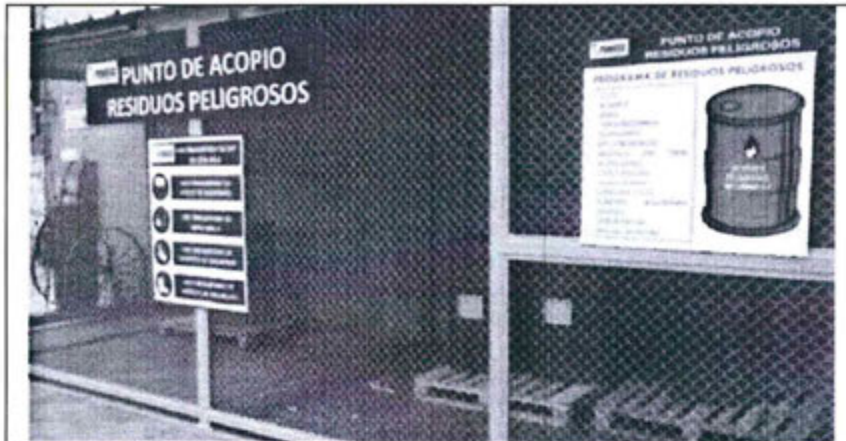
Foto N° 4: Área acondicionada con malla metálica y techada. Ubicados sobre la malla metálica tres carteles y uno de ellos denominado "punto de acopio de residuos peligrosos". En la parte interna hay varios contenedores de color rojo ubicados encima de parihuelas.