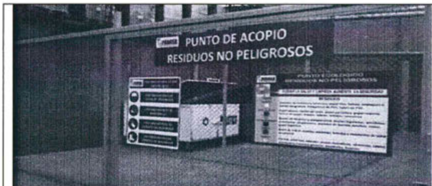
Foto N° 1: área enmallada con un cartel denominado "punto de acopio de residuos no peligrosos" y dos carteles adicionales, los tres ubicados sobre la malla metálica. Dos contenedores de forma rectangular con tapas y rotulados.