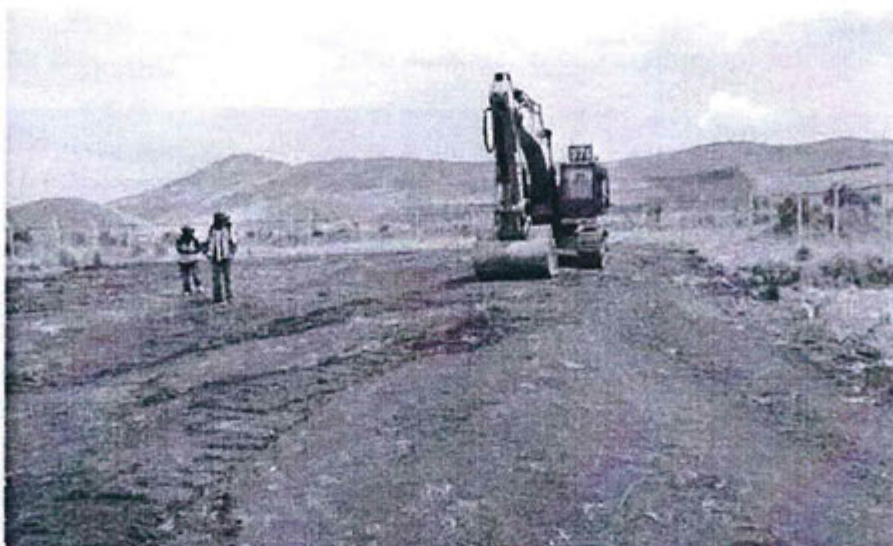
Poza adicional cerrada (15/11/2014)