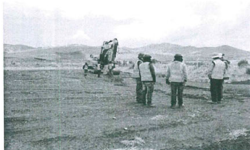
Colocación de material de cobertura: arcilla y top soil (15/11/2014)