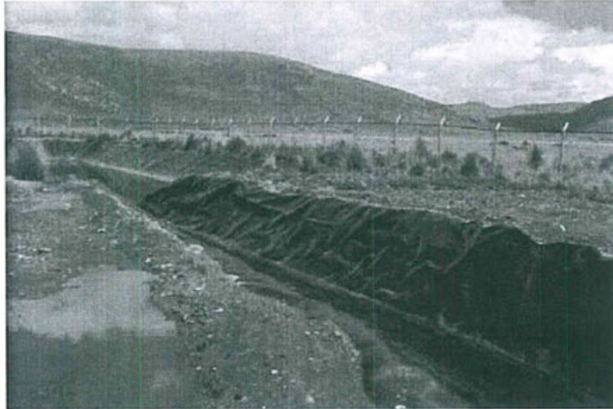
Canal construido en operación (15/12/2014)