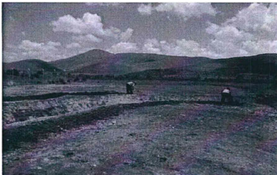
Construcción de canal de descarga a la Poza 7 (20/11/2014)