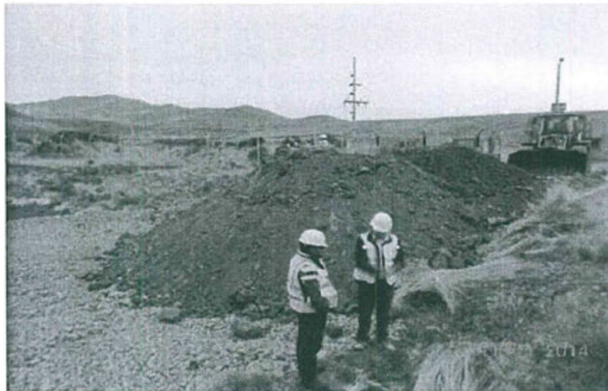
Transporte de arcilla para su posterior colocación (5/11/2014)