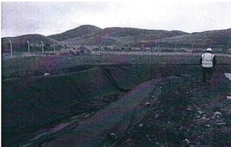
Colocación de geotextil en canal que descarga a la Poza 7