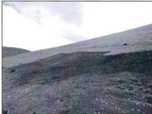
Plataforma de perforación JOT-2008-09 luego de los trabajos de cierre