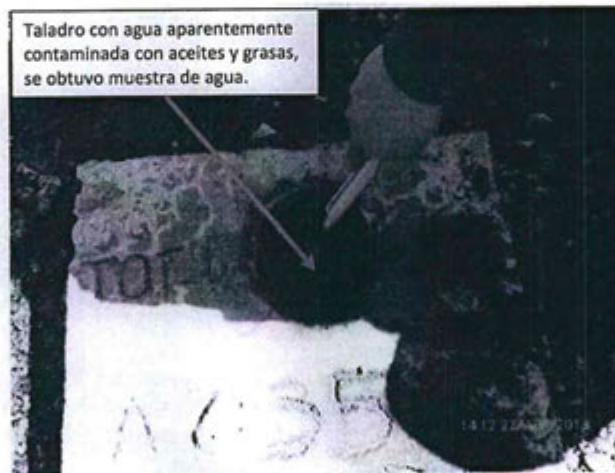
FOTOGRAFIA N° 9.- Plataforma JOT-09, entre las coordenadas UTM WGS84: E 0491628, N 8607176, se encuentra saturado con agua aparentemente contaminado con aceites y grasas.