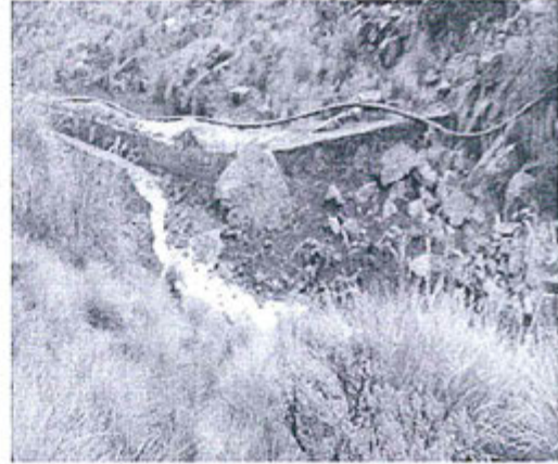
Fotografía N° 04.- Aguas de relave discurriendo en la quebrada Santa Catalina.