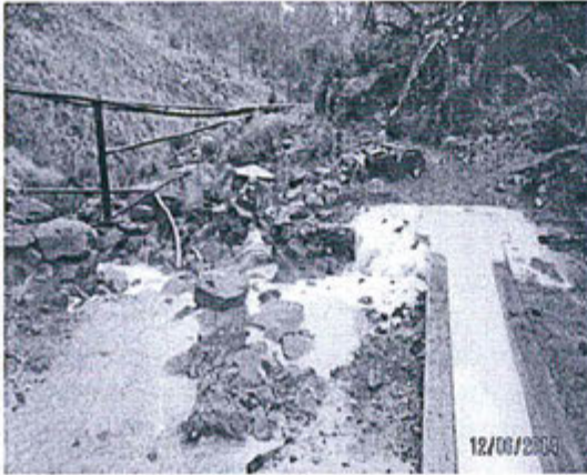
Fotografía N° 03.- Rebose de las aguas provenientes del depósito de relaves Santa Catalina en la caja de conexión con las tuberías. Nótase el flujo de agua que ingresa a la quebrada Santa Catalina.