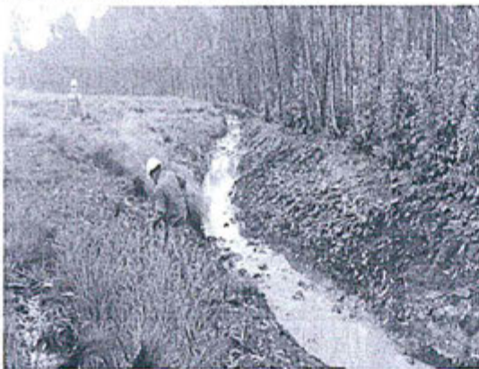
Fotografía N° 05.- Aguas de relave discurriendo en la quebrada Santa Catalina.