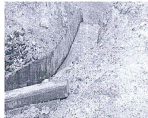
Fotografía N° 06.- Ingreso del vertimiento del subdrenaje derramado del depósito de relaves Santa Catalina al río Shorey.