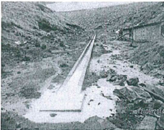
Fotografía N° 01.- Canal de conducción de subdrenajes del depósito de relaves Santa Catalina y el punto de rebose en primer plano.