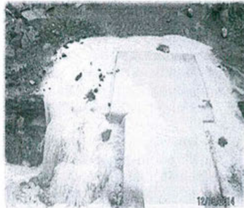
Fotografía N° 02.- Rebose de las aguas provenientes del depósito de relaves Santa Catalina en la caja de conexión con las tuberías. Nótese el flujo de agua que ingresa a la quebrada Santa Catalina.