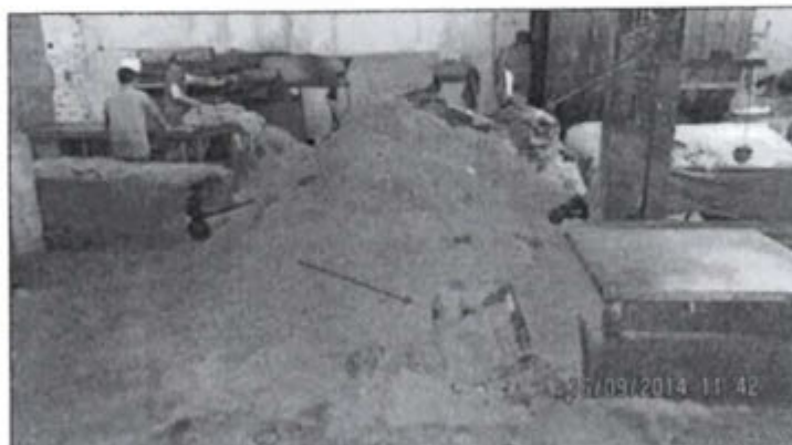
FOTOGRAFÍA N° 13: Frente del área de máquina rebajadora, se observa acumulación de viruta de cuero curtido (mayor a 2 m3) sobre piso de cemento, sin medio de contención y combinado con residuos de bolsa plástica y de papel (bolsa de cemento)