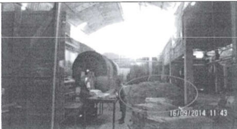
FOTOGRAFÍA N° 06: Máquina rebajadora, adyacente a botales de curtido de pieles.