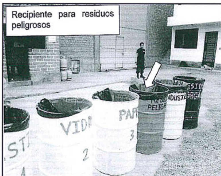
Fotografía N° 3: Recipientes para residuos peligrosos que no cuentan con tapas.