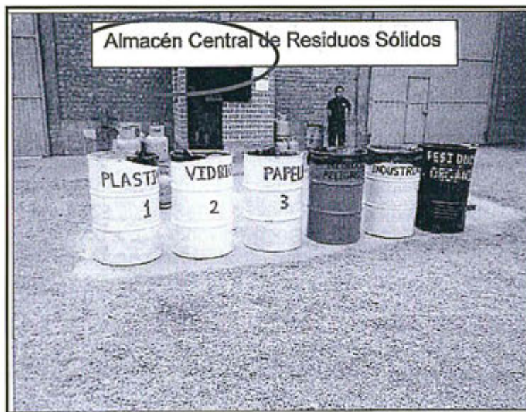
Fotografía N° 2 del Informe de Supervisión

Fotografía N° 2: Se observó que su Almacén Central para sus Residuos Sólidos no cuenta con suelo liso e impermeabilizado, no se encuentra cerrado ni cercado.