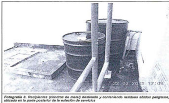
Fotografía 3. Recipientes (cilindros de metal) destinado y conteniendo residuos sólidos peligrosos, ubicado en la parte posterior de la estación de servicios