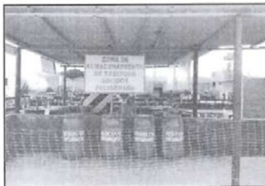
Fotografía N° 3 del escrito presentado el 15.01.16