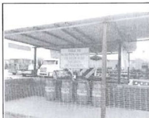
Fotografía N° 2 del escrito presentado el 15.01.16