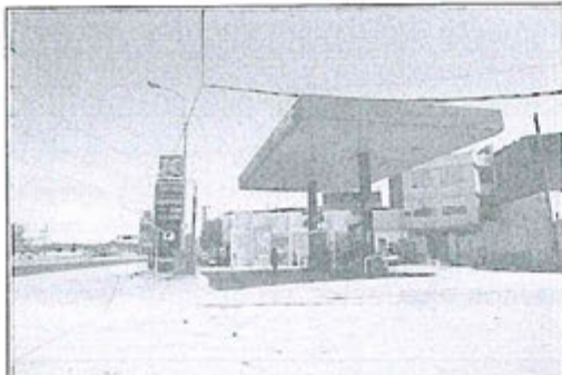
Fotografía N° 03.- Vista de la oficina administrativa, de la empresa HYTEK AUTOGAS S.A.C., ubicado en la Mz. C, Lote 1, Grupo Residencial N° 3, Pueblo Joven Nuevo Progreso (Av. Pachacútec N° 8035), distrito de Villa María del Triunfo, provincia y departamento de Lima. (UTM WGS84, Este: 0291261; Norte: 8647817).