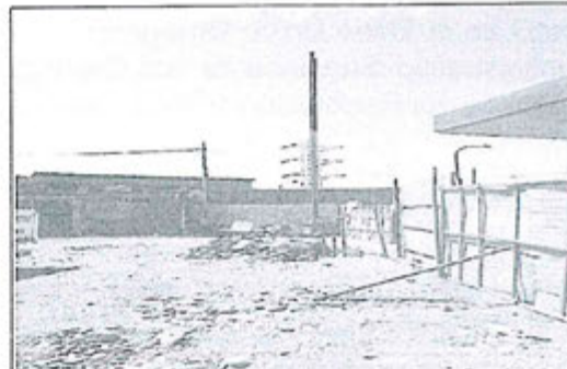
Fotografía N° 04.- Vista de la ubicación de los tubos de venteo (lado oeste), de la empresa HYTEK AUTOGAS S.A.C., ubicado en la Mz. C, Lote 1, Grupo Residencial N° 3, Pueblo Joven Nuevo Progreso (Av. Pachacútec N° 8035), distrito de Villa María del Triunfo, provincia y departamento de Lima. (UTM WGS84, Este: 0291273; Norte: 8647816).