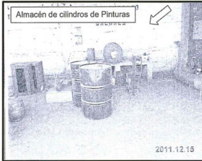
Fotografía N° 3: El almacén para productos químicos (pintura) no cuenta con doble contención y suelo impermeabilizado