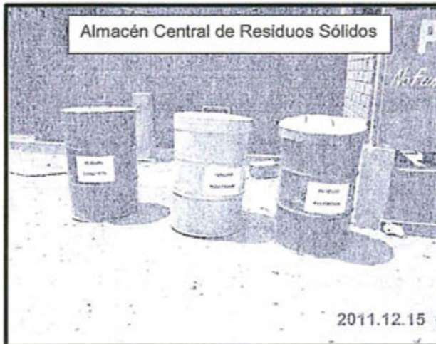
Fotografía N° 2: Se observó que su Almacén Central para sus Residuos Sólidos no cuenta con suelo liso e impermeabilizado, no se encuentra cerrado ni cercado

37. El hecho detectado se sustenta en la fotografía N° 2 del Informe de Supervisión N° 1151-2012-OEFA-DS 23 :