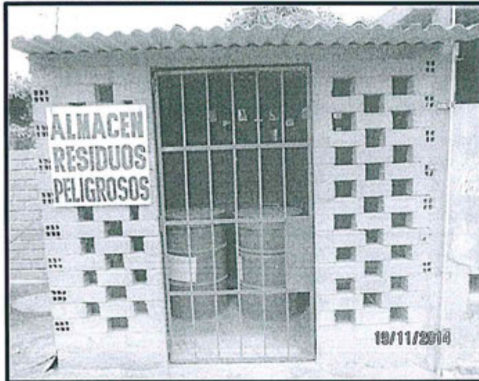
Fotografía N° 15: Almacén de residuos sólidos peligrosos coordenadas UTM GSW 84: 878219, 217296