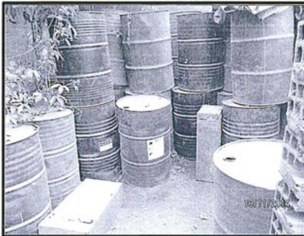
Fotografía N° 14: Almacenamiento de treinta (30) cilindros vacíos de pintura contacto directo con el suelo natural.