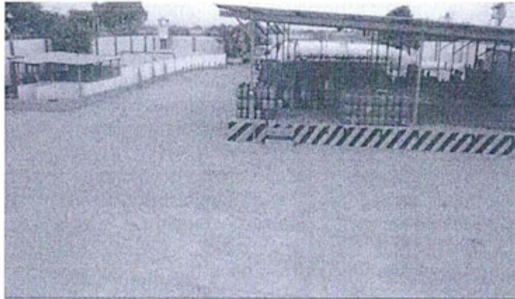
Fuente: Registro N° 14038 presentado por Zeta Gas el 12 de marzo de 2015.