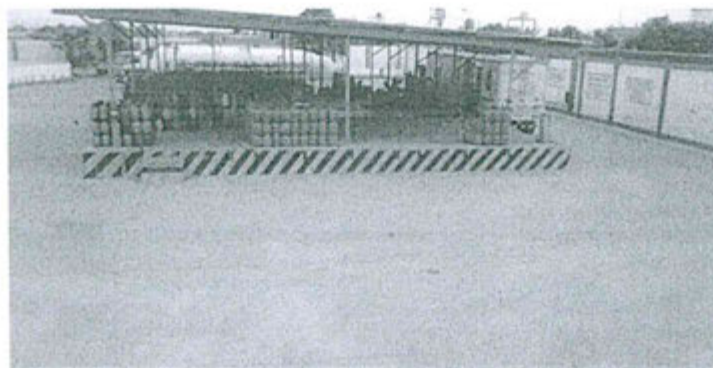
Fotografías presentadas por Zeta Gas

Fuente: Registro N° 14038 presentado por Zeta Gas el 12 de marzo de 2015.