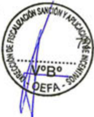
Fuente: Registro N° 04990 presentado por Zeta Gas el 20 de enero del 2016.

En tal sentido el administrado no habría subsanado la conducta infractora por contravenir lo establecido en el Artículo 48° del RPAAH, concordado con el Artículo 40° del RLGSR respecto de la obligación que el almacén central acondicionado en su Planta Envasadora de GLP cuente con un sistema contra incendios y la señalización que indique la peligrosidad de los residuos. En consecuencia, corresponde ordenar la siguiente medida correctiva de adecuación ambiental 35 :