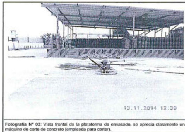
Fotografía N° 03: Vista frontal de la plataforma de envasado, se aprecia claramente una máquina de corte de concreto (empleada para cortar).