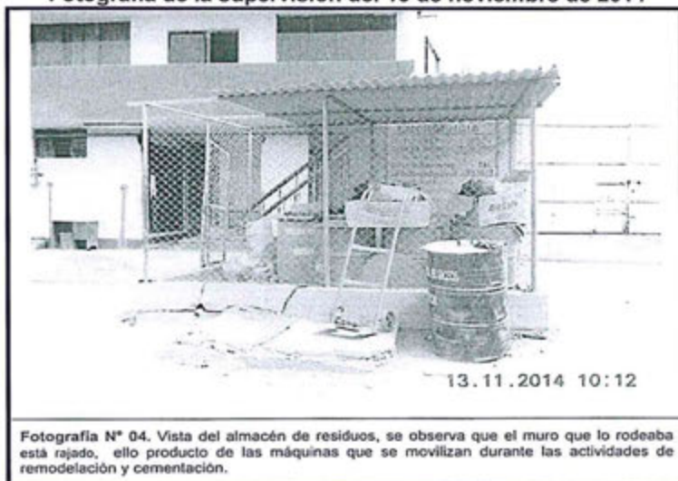
Fotografía de la supervisión del 13 de noviembre de 2014